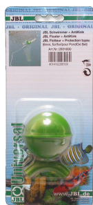
JBL plovák pro zahradní jezírka Plovák s ochranou proti zalomení pro sadu PondOxi