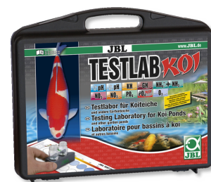
JBL Testlab Koi Prof. testovací kufřík pro koi a zahr. jezírka