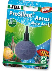
JBL ProSilent Aeras Micro Ball L Küçük hava kabarcıkları için hava taşı