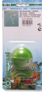
JBL Floater + AntiKink PondOxi Set için kıvrım önleyici donanımlı şamandıra