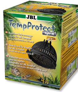
JBL TempProtect light JBL TempSet'ler için sürüng. yanıklı. karşı kor. aksam