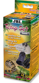
JBL TempSet basic Teraryumlarda kull. spot lambalar için montaj seti