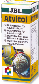
JBL Atvitol Akvaryum balıkları için multi vitamin damlaları