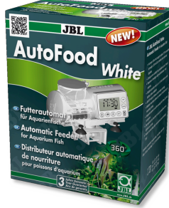
JBL AutoFood WHITE Akvaryum balıkları için beyaz yem otomatı