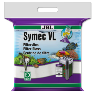
JBL Symec VL Vello d'ovatta contro tutti gli intorbidamenti