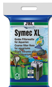
JBL Symec XL Wata filtracyjna o małej gęstości przeciwko wszystkim zmętnieniom wody