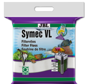
JBL Symec VL Filterwattenvlies tegen alle waterv vertroebelingen