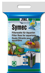
JBL Symec Filterwatten Filterwatten tegen alle waterv vertroebelingen