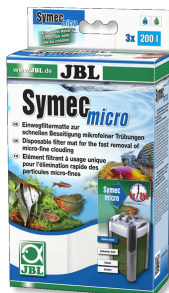
JBL Symec micro Microvlies voor aquariumfilters tegen vertroebelingen