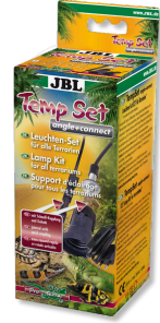
JBL TempSet angle+ connect Kit de instalação para refletores de terrário