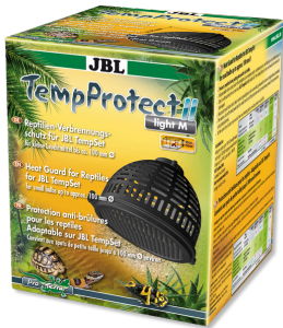
JBL TempProtect II light Proteção contra queimaduras de répteis p/ JBL TempSets