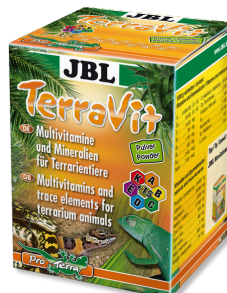
JBL TerraVit Vitamine ed elementi traccia per animali da terrario