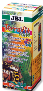
JBL TerraVit fluid Vitamine ed elementi traccia per animali da terrario