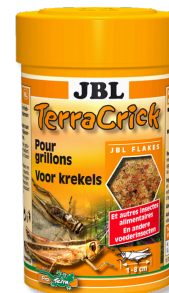
JBL TerraCrick Mangime completo per insetti da pasto