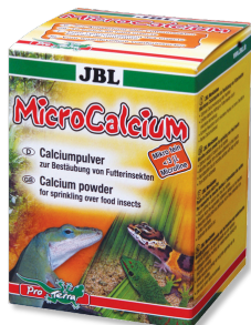
JBL MicroCalcium Mangime complementare con minerali per tutti i rettili