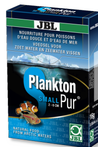
JBL Plankton Pur SMALL Friandises pour petits poissons d'aquarium