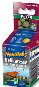
JBL NanoTabs Hoofdvoer voor garnalen en dwergkreeften