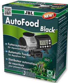
JBL AutoFood BLACK Zwarte voerautomaat voor aquariumvissen