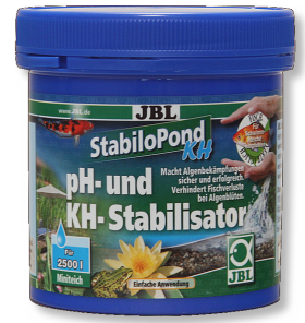
JBL StabiloPond KH