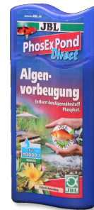
JBL PhosEx Pond Direct

pH ve KS değerini belirlemek için hızlı test