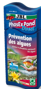
JBL PhosEx Pond Direct Fosfaatverwijderaar voor vijvers.