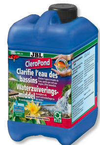
JBL CleroPond Clarificador de água para eliminar turvações da água