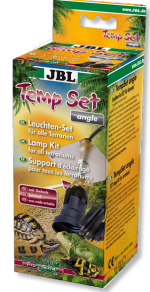
JBL TempSet dirsek Teraryumlarda kull. spot lambalar için montaj seti