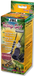
JBL TempSet connect Soket bağlantılı montaj seti