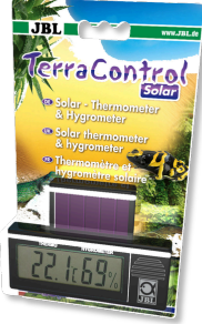
JBL TerraControl Solar Tüm teraryumlar için Solar termometre ve higrometre