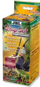
JBL TempSet dirsek+ bağlantı Teraryumlarda kull. spot lambalar için montaj seti