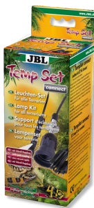
JBL TempSet connect Kit di installazione con connettore