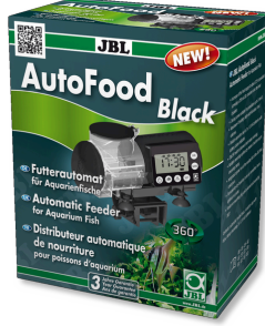
JBL AutoFood BLACK Akvaryum balıkları için siyah yem otomati