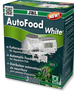
JBL AutoFood WHITE Akvaryum balıkları için beyaz yem otomati