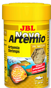
JBL NovoArtemio Дополнительный корм с артемией для аквариумных рыб