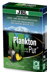
JBL PlanktonPur MEDIUM Лакомство для крупных аквариумных рыб