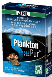
JBL PlanktonPur SMALL Лакомство для небольших аквариумных рыб