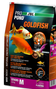
JBL PROPOND GOLDFISH M Bastoncini di mangime per pesci rossi medi/grandi