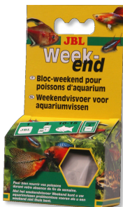
JBL Weekend Mangime weekend completo per tutti i pesci d'acquario