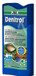
JBL Denitrol Startery bakteryjne do wpuszczenia ryb akwariowych