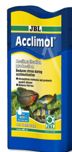
JBL Acclimol Preparat do uzdatniania wody do aklimatyzacji nowych ryb