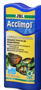
JBL Acclimol Preparazione dell'acqua per un nuovo ambientamento