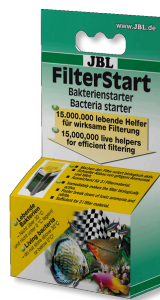
JBL FilterStart Batteri per l'attivazione del filtro