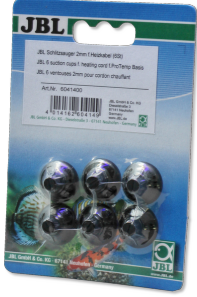
JBL yuvalı vantuz, 2mm Akvaryum ve teraryumlar için ısıtıcı kablo tutucu