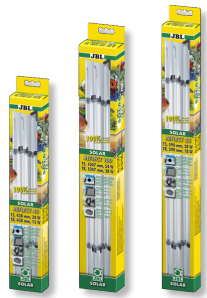
JBL SOLAR Reflect T5/ T8 - 895-1500 mm Reflektorblech für Solar- Leuchtstoffröhre