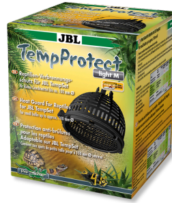
JBL TempProtect light Proteção contra queimaduras de répteis p/ JBL TempSets