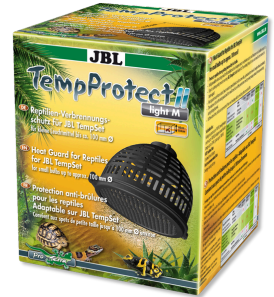
JBL TempProtect II light Proteção contra queimaduras de répteis p/ JBL TempSets