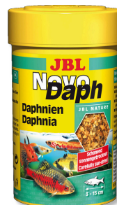
JBL NovoDaph Perloočky, pamlsky pro akvarijní ryby