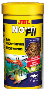
JBL NovoFil Larvy hmyzu pro vybíravé akvarijní ryby