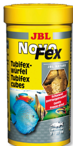
JBL NovoFex Tubifex cubes, pamlsky pro akvarijní ryby