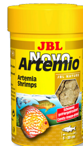
JBL NovoArtemio Doplňkové krmivo pro všechny akvarijní ryby artemia