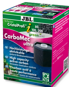
JBL CarboMec ultra CristalProfi i60/80/100/200 Bolsita con carbón activo para la gama CristalProfi i