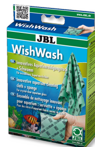
JBL WishWash Ścierka do czyszczenia i gąbka