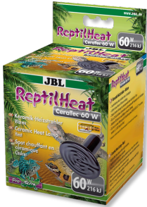
JBL ReptilHeat Spot chauffant en céramique