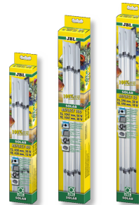
JBL SOLAR Reflect T5/ T8 - 895-1500 mm Reflectorplaat voor TL-buizen