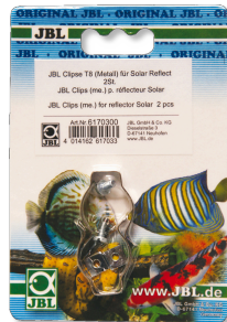
JBL Clips T5/T8 Metaal Metalen houder voor TL-buizen