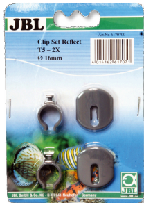
JBL SOLAR REFLECT clipset Houder voor TL-buizen