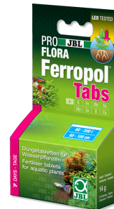
JBL PROFLORA Ferropol Tabs

Tatlı su akvaryumları için günlük bitki gübresi