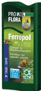
JBL PROFLORA Ferropol

Tatlı su akvaryumları için bitki gübresi