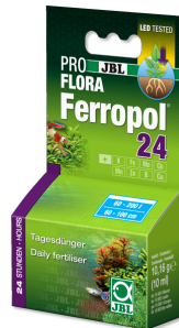
JBL PROFLORA Ferropol 24

Tatlı su akvaryumları için bitki gübresi