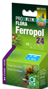
JBL PROFLORA Ferropol 24

Fertilizante para plantas para acuarios de agua dulce