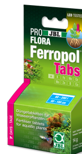
JBL PROFLORA Ferropol Tabs

Fertiliz. diario para plantas de acuario de agua dulce