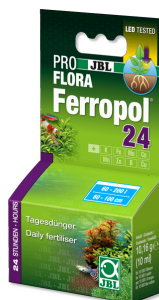
JBL PROFLORA Ferropol 24

Fertilizante para plantas para acuarios de agua dulce