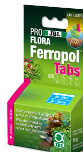
JBL PROFLORA Ferropol Tabs Plantenmest voor zoetwateraquaria