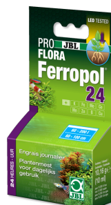
JBL PROFLORA Ferropol 24 Dagelijkse bemesting voor zoetwateraquaria