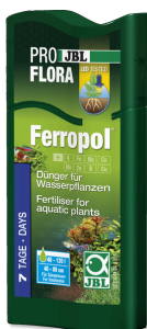
JBL PROFLORA Ferropol

Fertilizante para plantas para acuarios de agua dulce