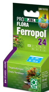
JBL PROFLORA Ferropol 24

Fertilizante para plantas para acuarios de agua dulce