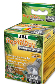
JBL ReptilDay Halogen

T8 Spec. Światłówka do terrarium dla zwierząt pustynn.