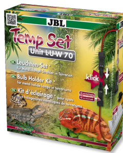
JBL TempSet Unit L-U-W Kit de instalação lâmpadas haileto metálico (LUW e HQI)