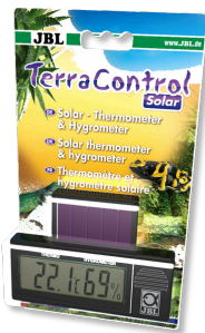
JBL TerraControl Solar Termómetro e higrómetro solar para todos os terrários