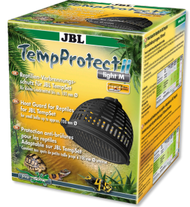
JBL TempProtect II light Proteção contra queimaduras de répteis p/ JBL TempSets