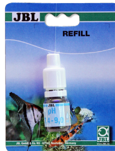
JBL pH 7,4-9,0 testi T. su akv. ve havuzl. için 7,4-9,0 aralığında pH testi