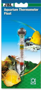
JBL Akvaryum termometresi, yüzen Akvaryum termometresi