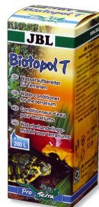
JBL Biotopol T

Aliment complet pour insectes alimentaires