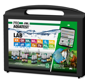
JBL PROAQUATEST LAB Maletín con 13 test para analizar el agua dulce