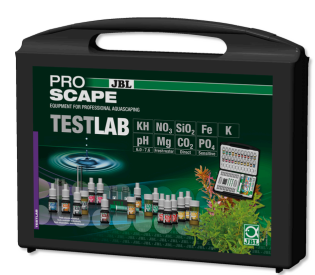
JBL PROAQUATEST LAB PROSCAPE Maletín de tests para analizar agua acuarios plantados