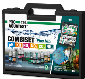
JBL PROAQUATEST COMBISET Plus NH 4 Maletín con los test más importantes + test de NH 4