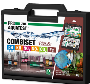
JBL PROAQUATEST COMBISET Plus Fe Maletín con los test más importantes + test de hierro