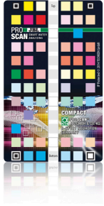
JBL PROSCAN ColorCard