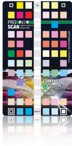
JBL PROSCAN ColorCard