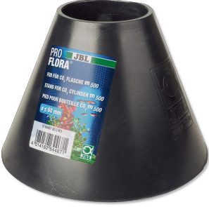
JBL PROFLORA 500 g'lık CO2 besleme tüpü ayağı

CO2 gübreleme cihazlarının tüpleri için altlık