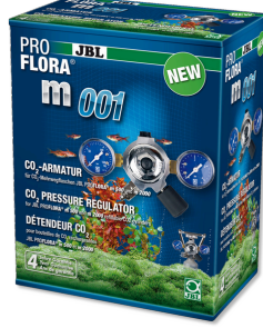
JBL PROFLORA m001 Basınç azaltıcı armatür

CO2 gübreleme cihazlarının tüpleri için altlık