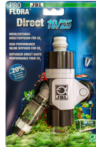
JBL PROFLORA Direct Difusor directo de alto rendimiento para CO2