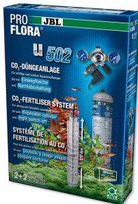
JBL PROFLORA u502 Sist. fertilizante plantas con sist. apagado nocturno