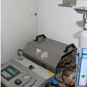
Relleno de CO2 JBL Servicio de relleno para bombonas de CO2 de JBL