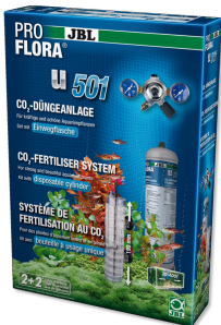
JBL PROFLORA u501 Kit completo de sistema fertilizante de plantas