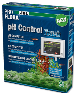
JBL PROFLORA pH-Control Touch Aparato de medición y regulación para controlar CO2/ pH