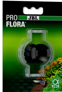
JBL Ventosa 37 mm Ventosa de goma con clip para objetos de 37-45 mm