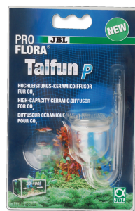
JBL PROFLORA Taifun P Minidifusor de CO2 para nano acuarios de agua dulce