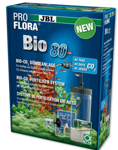
JBL PROFLORA Bio80 Sistema biol. fertilizante CO 2 con difusor de cristal