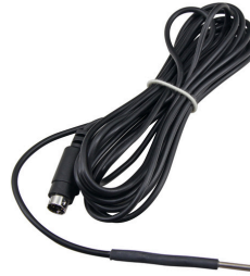
JBL pH Control Touch Sensor de temperatura