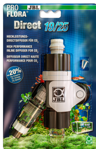
JBL PROFLORA Direct Diffusore diretto ad alto rendimento per la CO2