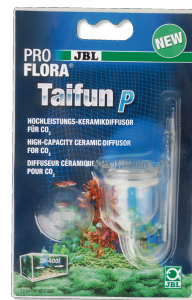
JBL PROFLORA Taifun P Minidifusor de CO2 para nano acuarios de agua dulce