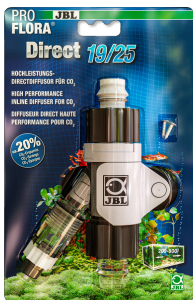
JBL ProFlora Direct Эффективный непосредственный диффузор для CO2