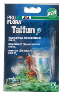
JBL PROFLORA Taifun P Mini-dyfuzor CO2 do akwariów słodkowodnych Nano