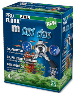
JBL PROFLORA m001 duo 2 adet CO2 difüzörü için basınç düşürme armatürü