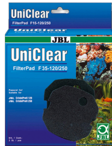
JBL FilterPad F35 CristalProfi akvaryum filtresi için ince sünger